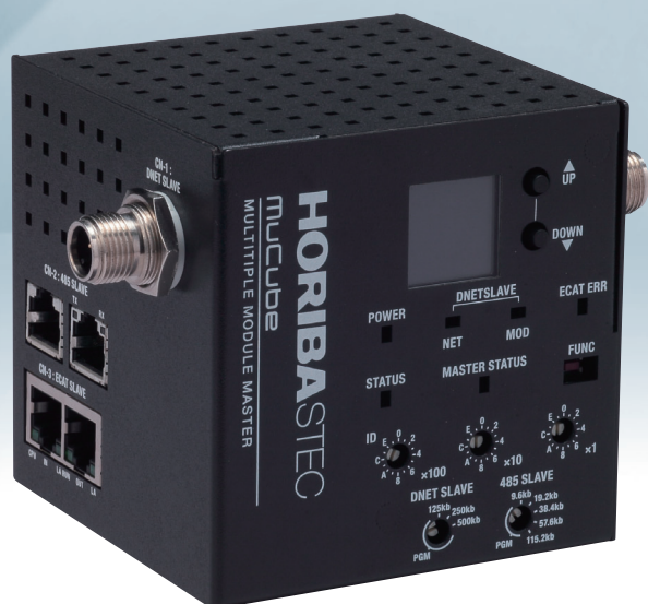
マスターコントローラ MuCube