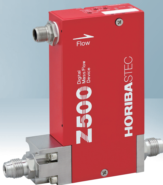
マスフローコントローラ